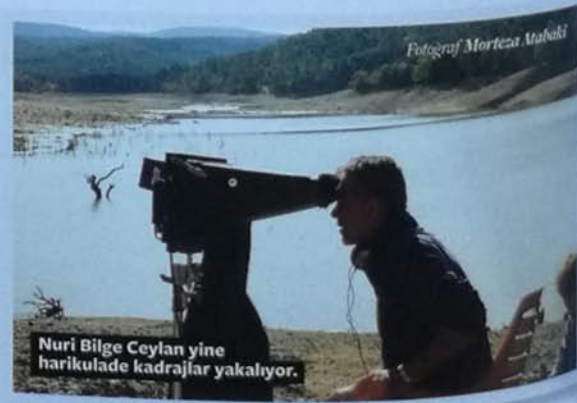
Nuri Bilge Ceylan yine harikulade kadrajlar yakalıyor.

Film Sinan'ın yolda rastladığı insanlarla olan sohbeti ve dolayısıyla hayatından muhtelif kesitler veren bölümlerle ilerliyor. Başlarda Sinan'ın Hazar Ergüçlü'nün canlandığı Hatice ile yaşadığı müthiş bir 'romantizm' sekansı izleyeceksiniz. Derken Ahmet Rifat Şungar'ın Rıza'sının güceniklik