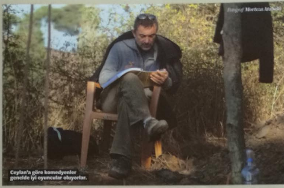
Ceylan'a göre komedyenler genelde iyi oyuncular oluyorlar.

bir senaryosu ve karakterlerle hareket eden bir kamerası var, adeta yeni bir meydan okuma. Nelerde zorlandığını sorduğumda "Hangi birini saysam?" diyerek başlıyor: "Ama yine de bu kadar konuşmalı bir senaryoda en zoru, herhalde, yazılan onca felsefi de denebilecek diyalogu karakterlerin ağzına öyle ya da böyle oturtmaya çalışıp bir şekilde inandırıcı ve hayata ait kılmaya çalışmak olmalı. Bu uğurda bazen filmin birtakım stilistik ve sinemasal tutarlılıklarından ödünler verilmek zorunda kalınsa bile, ki oluyor böyle şeyler, öncelik yine de bu inandırıcılığı sağlamaya çalışmakta benim için."