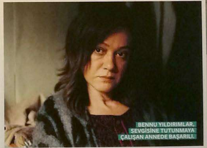
BENNU YILDIRIMLAR, SEVGİSİNE TUTUNMAYA ÇALIŞAN ANNEDE BAŞARILI.

Sinan karakteriyle üç saatlik filmi sırtında taşımaya başaran Aydın Doğu Demirkol, İdris'in içine yaptığı yolculuğu başarıyla yansıtan Murat Cemcir, bütün kaybetmişliklerin ortasında hâlâ sevgisine tutunmaya çalışan anne Asuman'da Bennu Yıldırım lar başta olmak üzere, kendi bölümlerini zirveye taşıyan bir oyuncu kadrosu var filmin. Hazar Ergüçlü, Ahmet Rıfat Şungar, Serkan Keskin, Kadir Çermik, Kubilay Tunçer, Akın Aksu, Öner Erkan, Asena Keskinci, Tamer Levent, Ercüment Balakoğlu, Özay Fecht unutulmaz karakterlere imza atmaya başarıyor.