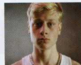
Mommy (2014) YÖN: XAVIER DOLAN