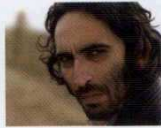
Bir Zamanlar Anadolu'da (2011) YÖN: NURİ BİLGE CEYLAN