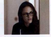
Sils Maria (Clouds of Sils Maria, 2014) YÖN: OLIVIER ASSAYAS