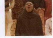
Timbuktu (2014) YÖN: ABDERRAHMANE SISSAKO