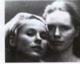
Persona (1966) YÖN: INGMAR BERGMAN