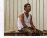
Futatsume no mado (Still the Water, 2014) YÖN: NAOMI KAWASE