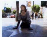
Maps to the Stars (2014) YÖN: DAVID CRONENBERG