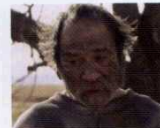
The Homesman (2014) YÖN: TOMMY LEE JONES