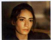
Kış Uykusu (2014) YÖN: NURİ BİLGE CEYLAN