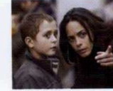
The Search (2014) YÖN: MICHEL HAZANAVICIUS