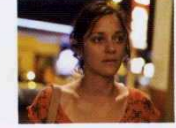
Deux Jours, Une Nuit (Two Days, One Night, 2014) YÖN: JEAN-PIERRE DARDENNE, LUC DARDENNE