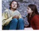
Le Meraviglie (The Wonders, 2014) YÖN: ALICE ROHRWACHER