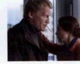
Leviathan (Leviathan, 2014) YÖN: ANDREY ZVYAGINTSEV