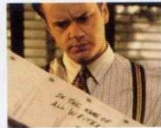
Oyuncu (The Player, 1992) YÖN: ROBERT ALTMAN