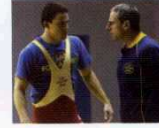
Foxcatcher (2014) YÖN: BENNETT MILLER