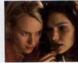
Mulholland Çıkmazı (Mulholland Dr., 2001) YÖN: DAVID LYNCH