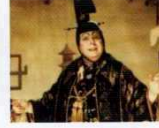
Karmakarışık (Topsy-Turvy, 1999) YÖN: MIKE LEIGH