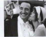
Artist (The Artist, 2011) YÖN: MICHEL HAZANAVICIUS