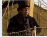
Mr. Turner (2014) YÖN: MIKE LEIGH