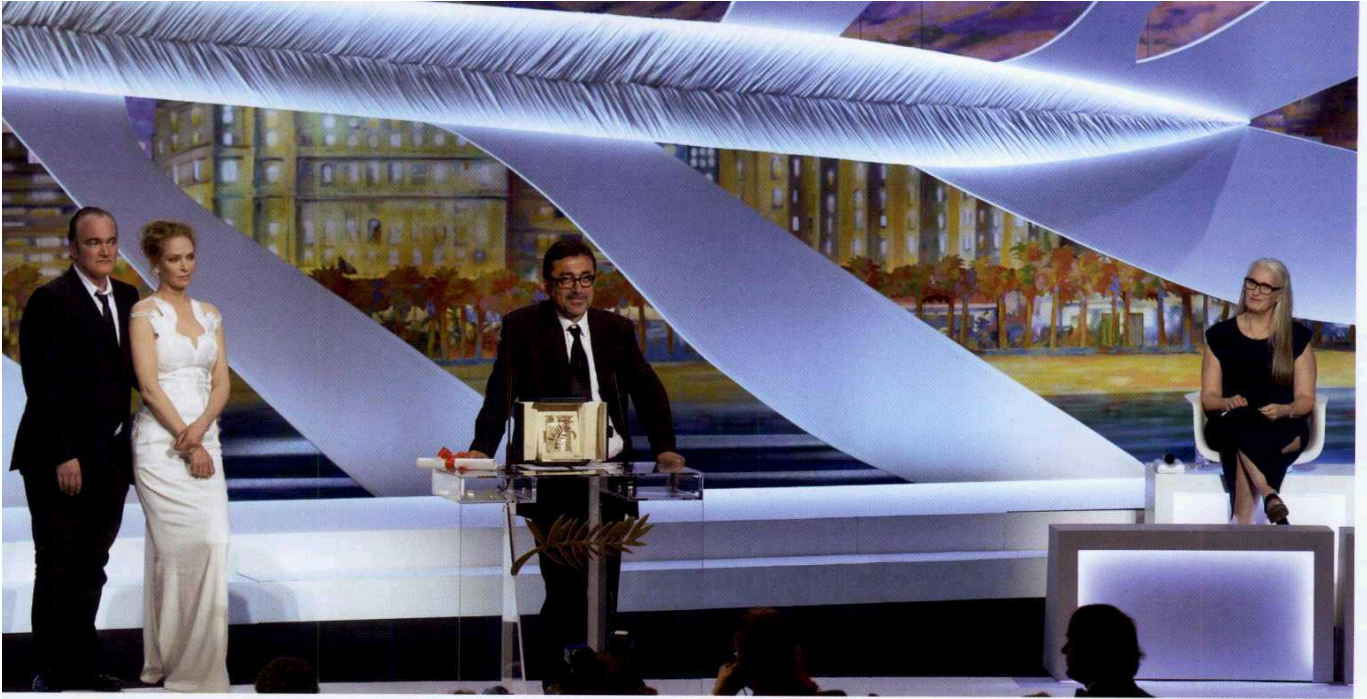
Nuri Bilge Ceylan Jane Campion'ın başkanlığı yaptığı jürinin verdiği ödülü, Quentin Tarantino ve Uma Thurman'ın elinden aldı.

ama bu derece yoğun ve karmaşık bir metnin izleyici tarafından hazmedilebilmesi için olabildiğince net biçimde perdeye taşınması gerekiyor zaten. Ceylan Kapadokya'nın rüyavari dokusunu ustalıkla filmine yansıtıyor, iç mekân sahnelerinde ışık ve renklerle yaratıcı biçimde oynuyor. Ama görselliğin metnin önüne geçmemesine de özen gösteriyor. Son derece zorlu bir işin altından kalkan yönetmenin sinemamıza yeni bir başyapıt kazandırdığını belirtmek ve tüm film ekibini şimdiden kutlamak gerek.