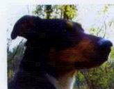
Goodbye to Language (Adieu au Langage, 2014) YÖN: JEAN-LUC GODARD