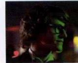
Saint Laurent (2014) YÖN: BERTRAND BONELLO