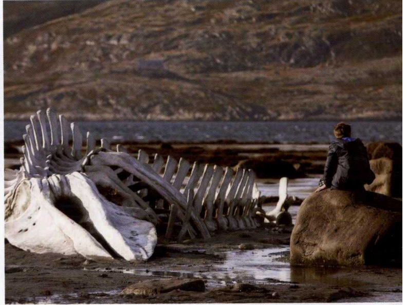
Andrey Zvyagintsev'in Leviathan 'ın En İyi Senaryo ödülüne layık görüldü.

Genel seviye ne kadar yüksek olursa olsun, festivallerde her zaman kimi hayal kırıklıkları da oluyor. Jüri Ödülü'nü Godard'ın Goodbye to Language 'yle paylaşan Xavier Dolan'ın Mommy 'si beni ciddi biçimde rahatsız eden bir film oldu. iPhone ekranı formatında, 5:4 oranında çekilmiş bu yorucu film, kendi filmlerindeki her sahneyi fazlasıyla seven bir yönetmenin imzasını taşıyor. Basit, fazlasıyla duygusal bir öyküyü 135 dakikaya yayan Dolan, bazı popüler şarkıların tamamını dinlediğimiz bir videoklip silsilesi oluşturuyor, sürekli ağır çekime başvuruyor ama tüm oyunbazlığına rağmen anlamlı bir bütün kuramıyor. Yönetmen hiçbir amaç gütmeyen ya da belli bir planı takip etmeden aklına gelen bütün numaraları deneyen hevesli bir çocuk gibi adeta. İlk kez bir Dolan filmi merkezine orta yaşlı bir karakteri yerleştiriyor ve söz konusu disiplinsiz üslup, özellikle Dolan'ın yetişkin psikolojisini anlama ve anlatma konusundaki yetersizliği düşünüldüğünde, her zamankinden daha anlamsız ve rahatsız edici hale geliyor. Festivalin genel olarak beğenilmeyen filmleri arasında Tommy Lee Jones'un ikna edici olmayan tuhaf bir öyküyü son derece demode şekilde perdeye taşıdığı monoton western The Homesman , Bertrand Bonello'nun görsel açıdan