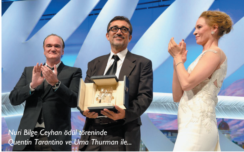
Nuri Bilge Ceyhan ödül töreninde Quentin Tarantino ve Uma Thurman ile...

İnsanoğlunun kadim dinlerin kendi dünyasındaki huzuruna ve öğretilerine yönelmesi... Bu tür çok