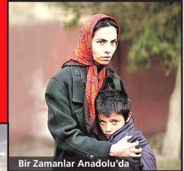
Bir Zamanlar Anadolu'da