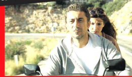
Nuri Bilge Ceylan "İklimler" filminde eşi Ebru Ceylan ile...

COEN kardeşler 2007'de çektiikleri kısa filmleri "World Cinema"da "İklimler"e göndermelerde bulunmuşlardı. Alman Die Zeit gazetesine verdikleri söyleşiden bir bölüm: